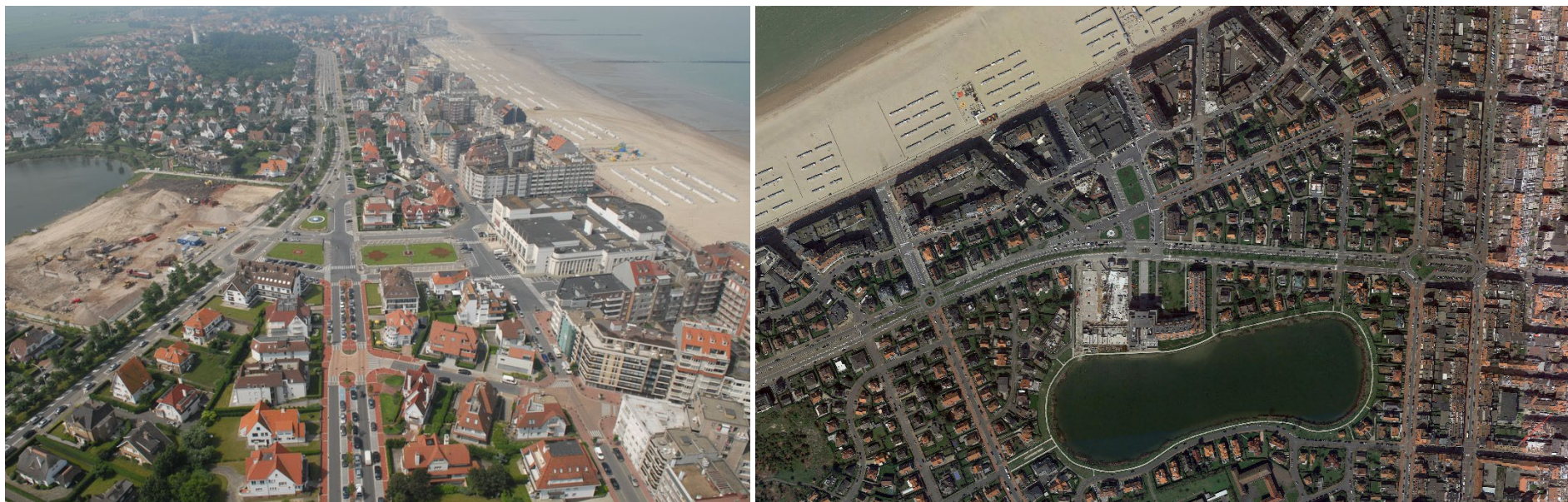
Projectzone, foto links beeld uit 2008 (bron onbekend) | foto rechts beeld Google Earth (april 2018)